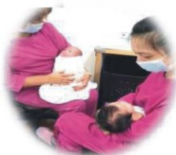
李OO 產後護理之家 職稱：保育員