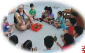
連OO 非營利幼兒園 職稱：教保員