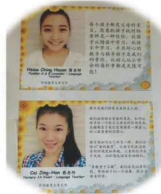
蕭OO、陳OO 新加坡幼兒園 職稱：教保員