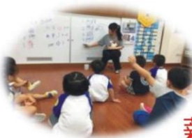
郭OO 非營利幼兒園 職稱：教保員