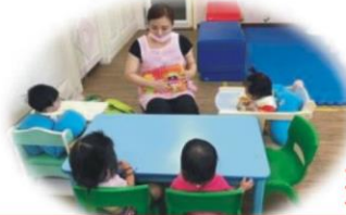
陳OO 公共托育中心 職稱：教保員